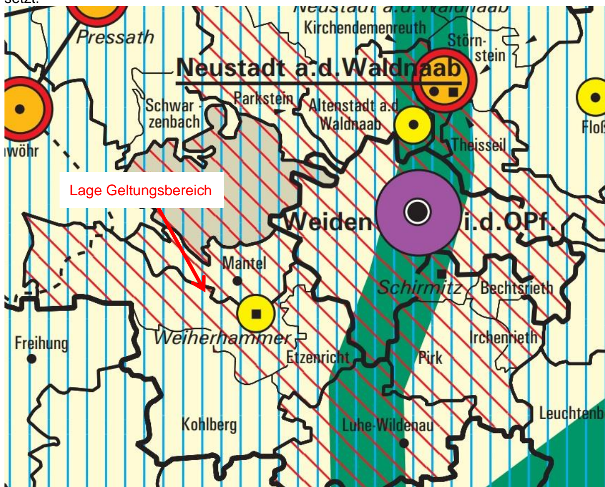
Abb. 2: Ausschnitt aus dem Regionalplan Oberpfalz –Nord.

Nach § 1 Abs. 4 BauGB sind Bauleitpläne den Zielen der Raumordnung anzupassen. Diese Ziele sind im Regionalplan in Form der regionalen Siedlungs- und Freiraumstruktur festgesetzt.