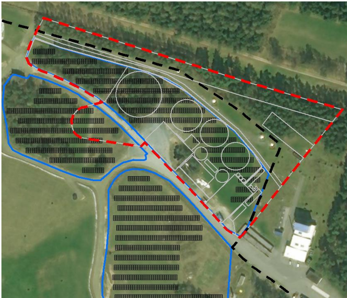
Abb. 1: Geltungsbereich der 1. Änderung im Luftbild (Quelle Luftbild ESRI, technische Planung sm energy)

Als Standort auf dem Deponiegelände ist der bisher unbebaute Abschnitt D des Solarparks sowie Flächen östlich davon, außerhalb des bisherigen Geltungsbereiches, vorgesehen.